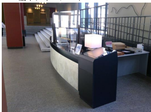
<空中ディスプレイ>